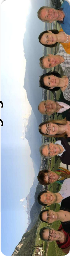
Cette photo est un montage. Toutes les règles d'hygiène et de distanciation ont été respectées.